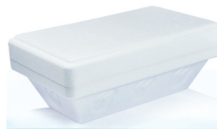
KA750CA g 750