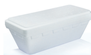
T1000 ml 925