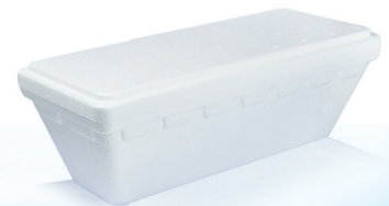
T1500 ml 1.460