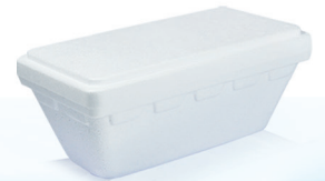
T750 ml 825