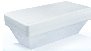
KA1500CA g 1.500