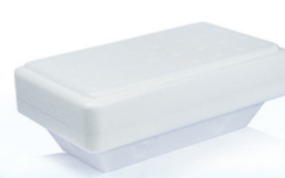
KA450CA g 350