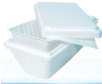
Serie T Litro per la Vendita al Litro T Liter Series for Liter Sale