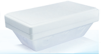
KA1000CA g 1.000