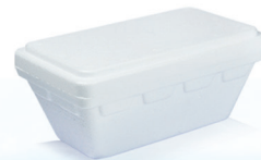
T500 ml 520