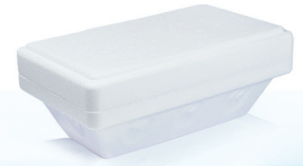
KA500CA g 500