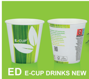
ED E-CUP DRINKS NEW