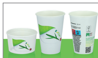
EC E-CUP NEW