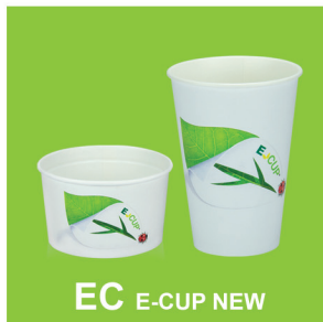
EC E-CUP NEW