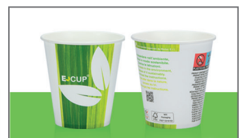
ED E-CUP DRINKS NEW