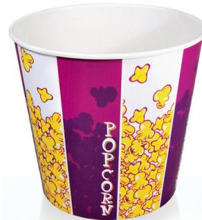
B130 ml 3.850