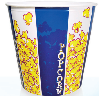
B170 ml 5.520