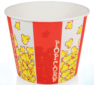
B99 ml 2.950