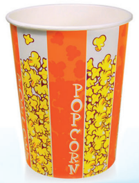
B32 ml 1.000