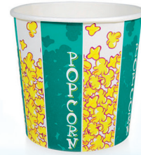
M90 ml 897