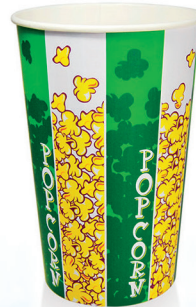
B45 ml 1.310