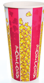
B24 ml 707