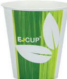
ED E-CUP DRINKS NEW