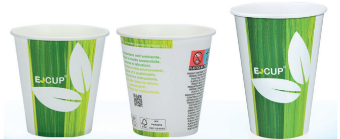
VKFB ml 168