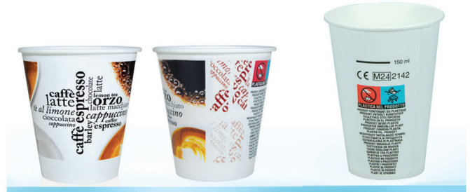
VK ml 168