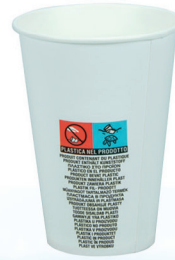
VCK ml 218